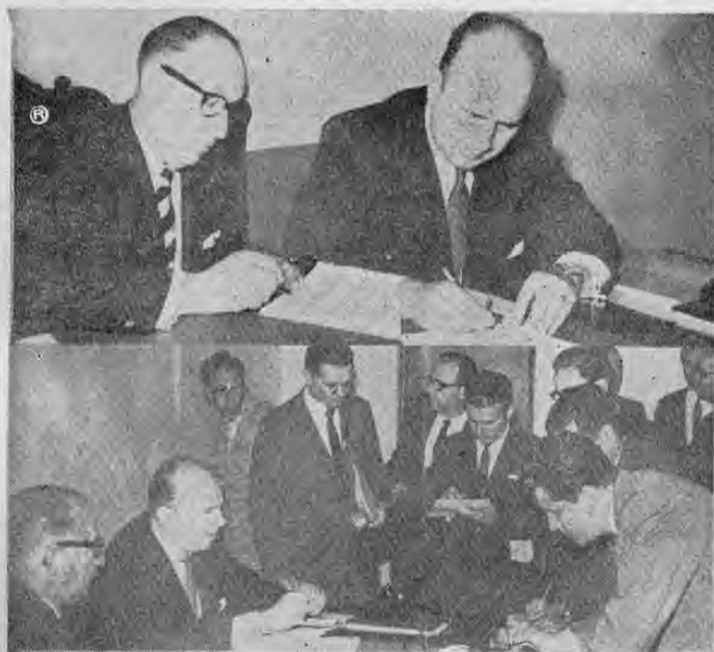
Arriba a la izquierda, el Presidente de la República don Francisco J. Orlich y a la derecha el doctor Felipe Herrera, están sus firmas en el convenio suscrito entre el Gobierno de