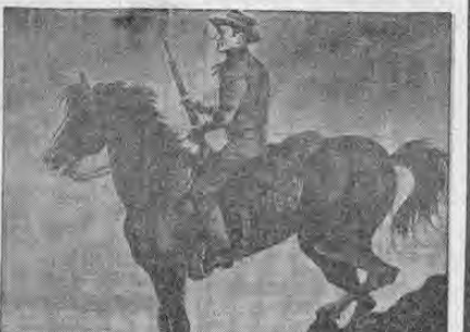
LOS VALIENTES ANDAN SOLOS

en el poético, solitario y humano drama DE UN HOMBRE Y SU CABALLO. acusado por la justicia huyendo DE SI MISMO, SIN AMOR, SIN REPOSO, SIN GUSTO DE LA VIDA!!