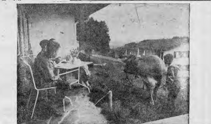
Entre el silencio de las montañas del Altiplano pasan unas vacaciones casi gratuitas unas cuantas familias numerosas de Berlín. Rodeado de bosques y praderas se alza en una altiplanicie el poblado de vacaciones de Nadenberg, inaugurado en 1950. Se ve desde él el Lago de Constanza que está a 12 kilómetros. Estas familias disponen de unas 75 castitas con cocinas completamente equipadas, instalaciones sanitarias, con sus lugares de juegos y jardines de infancia, ha sido instalada por la obra de ayuda a Berlín. De mayo a noviembre vienen aquí semanalmente 25 familias que pasan 3 semanas en este lugar para reponerse de la visión de las alambradas y de la muralla erigida por el régimen comunista de Ulbricht a lo largo de la frontera de los sectores de Berlín. La foto muestra a una familia en la terraza de su domicilio de vacaciones de Nadenberg. Para el desayuno ha ocurrido un invitado de cuatro patas, que parece interesarse en algo más que por la hierba y por los treboles.

WASHINGTON, 16. AP.— El primer informe de progreso sobre la Alianza para el Progreso fue sometido a la organización de Estados Americanos (OEA) por Colombia para su consideración en la próxima reunión del Consejo Económico y Social de la OEA en México. El informe cubre el primer año de la labor de la Alianza para el Progreso en Colombia. El Consejo Económico y Social se reunió en México a partir del primero de octubre en el nivel de expertos y el 22 de octubre en el nivel de ministros de hacienda. La reunión fue aplazada de agosto porque gran parte de la documentación, especialmente informes de países individuales.