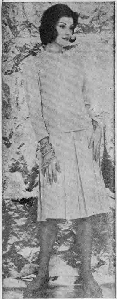
"Quendalina" es el nombre italiano de este modelo de tejido de punto de fibra acrílica "Orlon", de chaqueta cuadrada y falda plisada, en color azul claro. La chaqueta sin cuello lleva en vez un adorno de trenilla del mismo color. La falda de grandes pliegues plisados es de vuelo moderado.